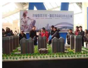
Shenyangs Immobilienausstellung im März 2010

Autor Martin Brandes ist ein Kenner der chinesischen Szene. Seit sieben Jahren lebt er dort und arbeitet als Dokumentarfilmer und Medienberater. Nach seinen Erfahrungen ist es auch für (europäische) Langnasen ganz einfach, China zu verstehen. Er empfiehlt den Besuch der "Tempel des wahren chinesischen Glücks - die opulenten, vornehmen, glitzernden Showrooms der unzähligen Immobilienanbieter".