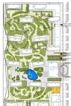
Landschaftsplan "Euro Homes - Noble Dreams"

Die Garten- und Landschaftsplanung spiegelt den intensiven Gedankenaustausch mehrerer Fachplaner wider. Unsere Ingenieure in Beijing (dem für deutsche Ohren besser vertrauten Peking) und am Projektstandort Shenyang haben mit den international anerkannten Designern des von uns beauftragten Architektenbüros Progetto Architectural Design aus Mailand erfolgreich zusammen gearbeitet. Das Ergebnis ist der Masterplan, der in bestem west-östlichen Zusammenspiel das von Chinesen hoch geschätzte landschaftliche Erscheinungsbild mit edlem europäischem Stil verbindet. Auch künftig werden unsere Ingenieure, die lokalen Architekten in Shenyang und die italienischen Designer hart arbeiten, um die Planung perfekt zu verwirklichen.